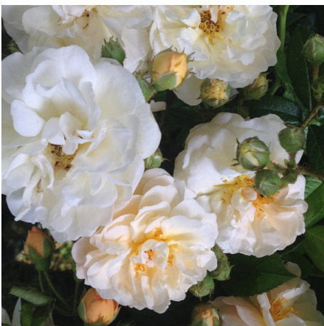
Ghislaine de Feligonde