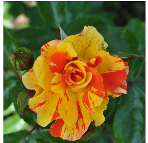
Papagena/Oranges & Lemons®