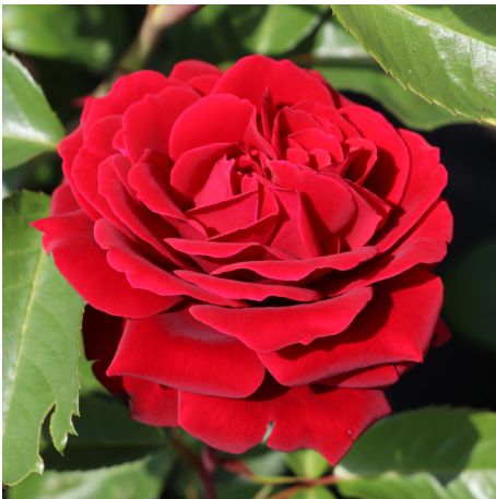
That's Jazz / Naheglut