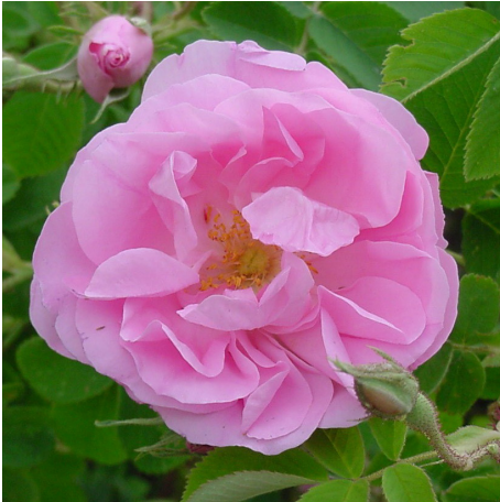
R. damascena Trigintipetala/Kazanlik