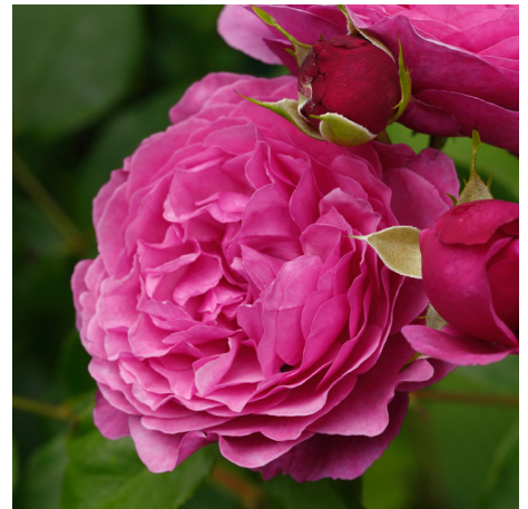
Kaffe Fassett Rose®