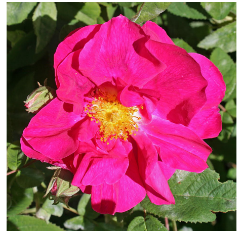
R. Gallica Officinalis / Apothekerrose