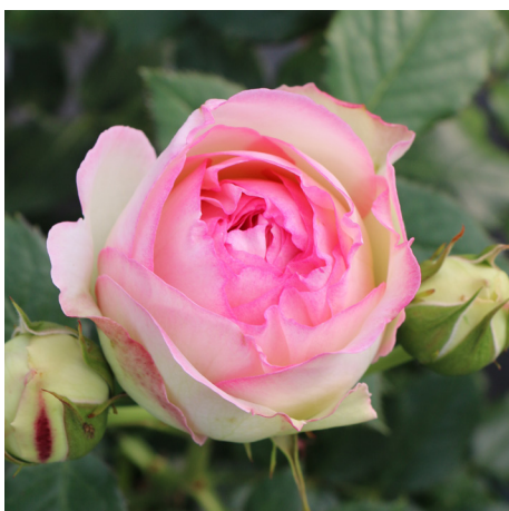
Eden Rose 85®

Blüte rosa Duft leicht Wuchs 120 cm Züchter Lens 2002