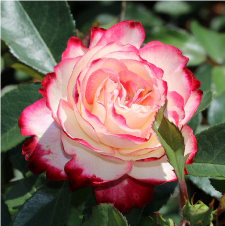
Jubilee du Prince de Monaco®