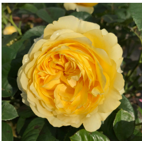
Yellow Flower Village®

Blüte pfirsich-orange Duft stark Wuchs 80 cm Züchter Tantau 2001