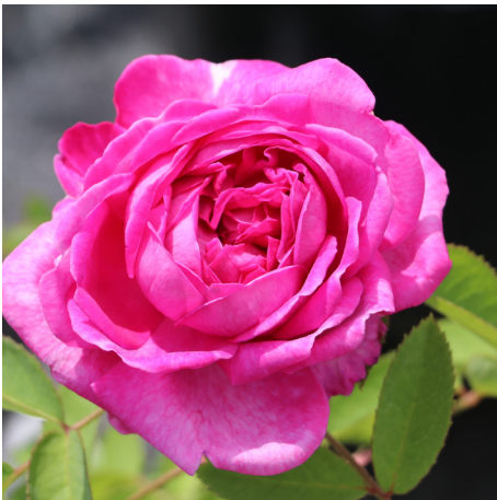
La Reine Victoria