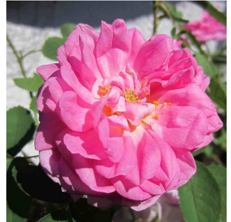
R. damascena bifera/Quatre Saisons