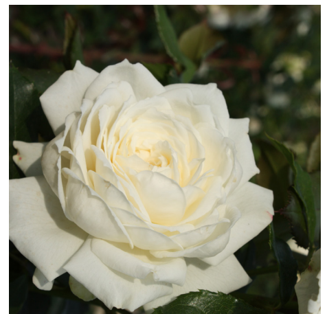
Alaska / Future®