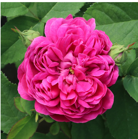
Rose de Resht