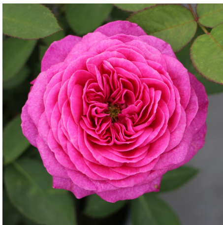
Heidi Klum Rose®