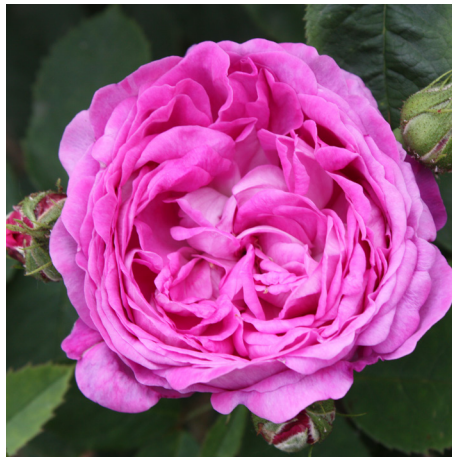
Reine des Violettes