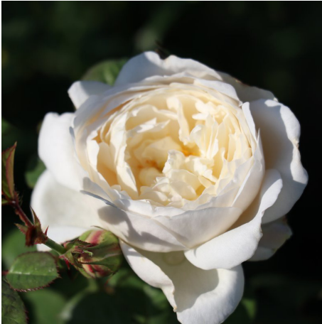
William und Catherine®

Blüte weiß Duft mittel Wuchs 120 cm Züchter Austin 2011