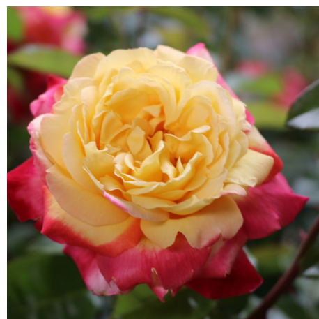
Pullmann Orient Express®

Blüte lichtgelb mit rosa Rand Duft leicht Wuchs 80 cm Züchter Meilland 1945