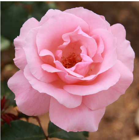
The Queen Elizabeth Rose