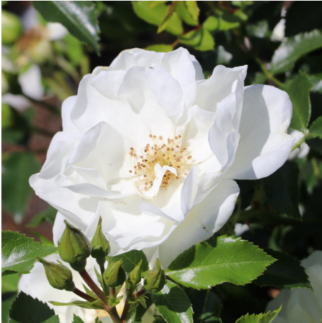
Flower Carpet Schneeflocke®