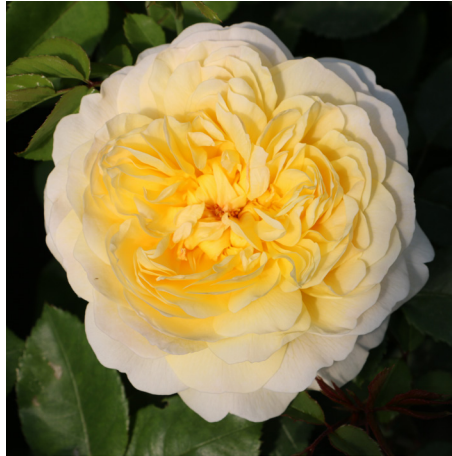
The Poet's Wife®

Blüte weiß Duft mittel Wuchs 120 cm Züchter Austin 2011