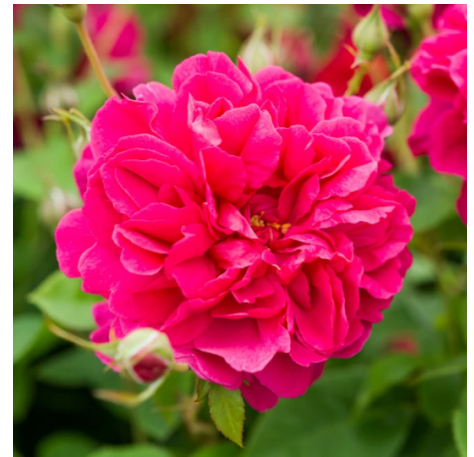
Thomas á Becket®

Blüte kupferorange Duft leicht Wuchs 120 cm Züchter Austin 2009