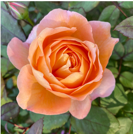
Lady Emma Hamilton®

Blüte goldgelb Duft stark Wuchs 150 cm Züchter Austin 1992