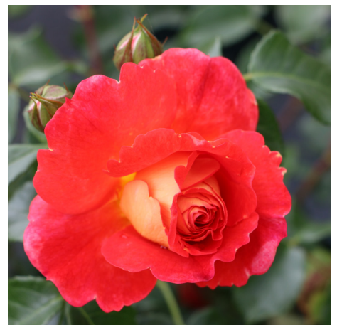
Gebrüder Grimm/Joli Tambour®