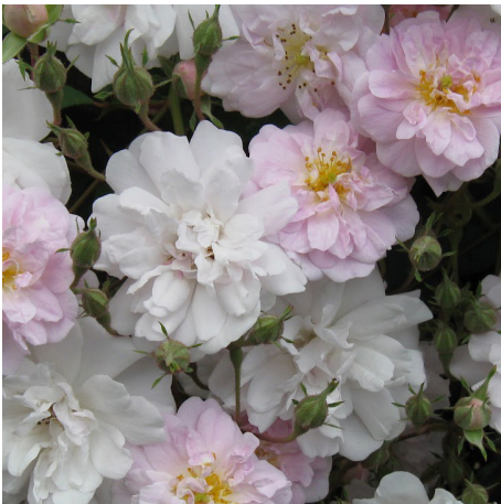
Pauls Himalayan Musk