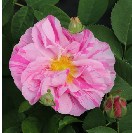
Rosa gallica Versicolor