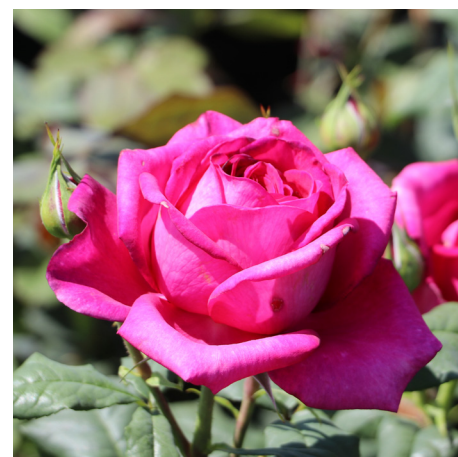
Johann Wolfgang von Goethe®

Blüte pink Duft stark Wuchs 120 cm Züchter Meiland 1983