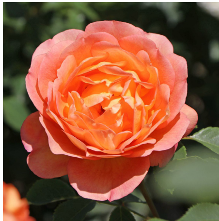
Lady of Shalott®

Blüte lachsorange Duft stark Wuchs 120 cm Züchter Austin 2005